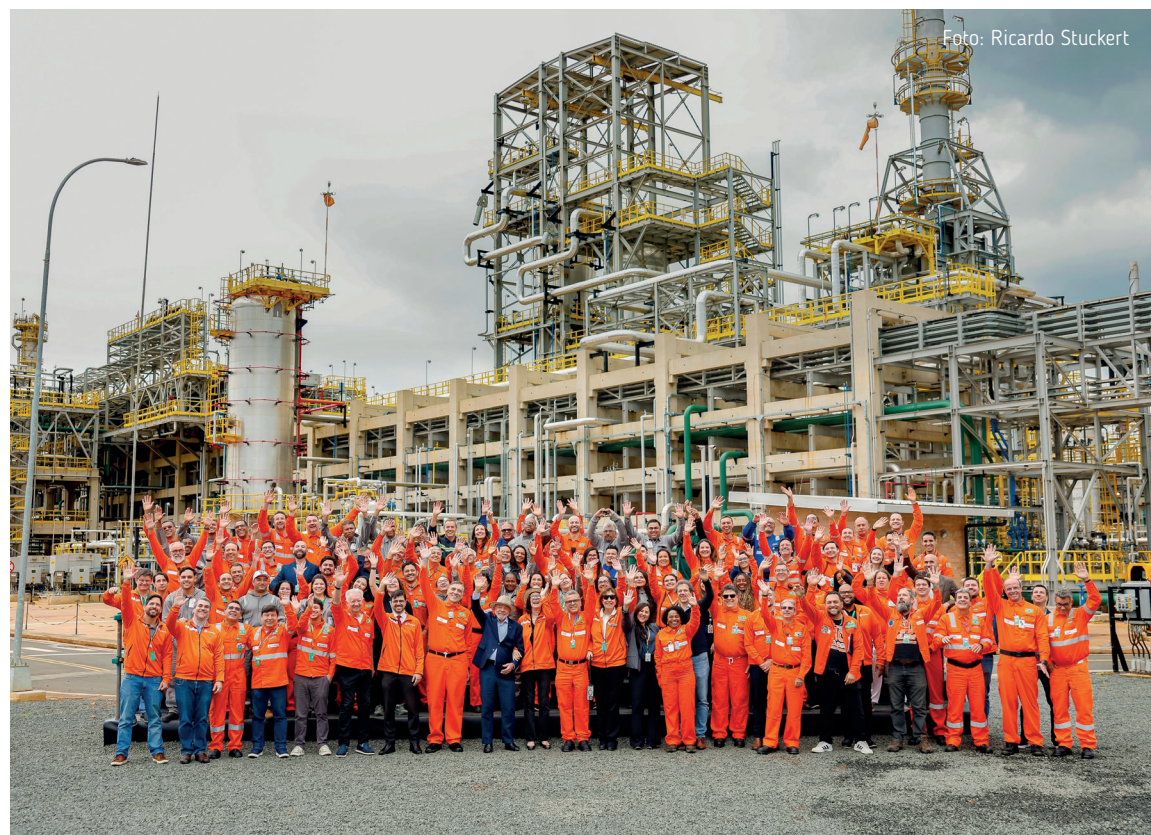
Petroleiros e petroleiras aprovaram em assembleia apoio à reeleição de Lula

Fizemos nosso Congresso, elegemos a delegação que vai nos representar e estamos prontos para o Confup. Será um ano de muita luta, como sempre fizemos e faremos, não fugiremos dela.