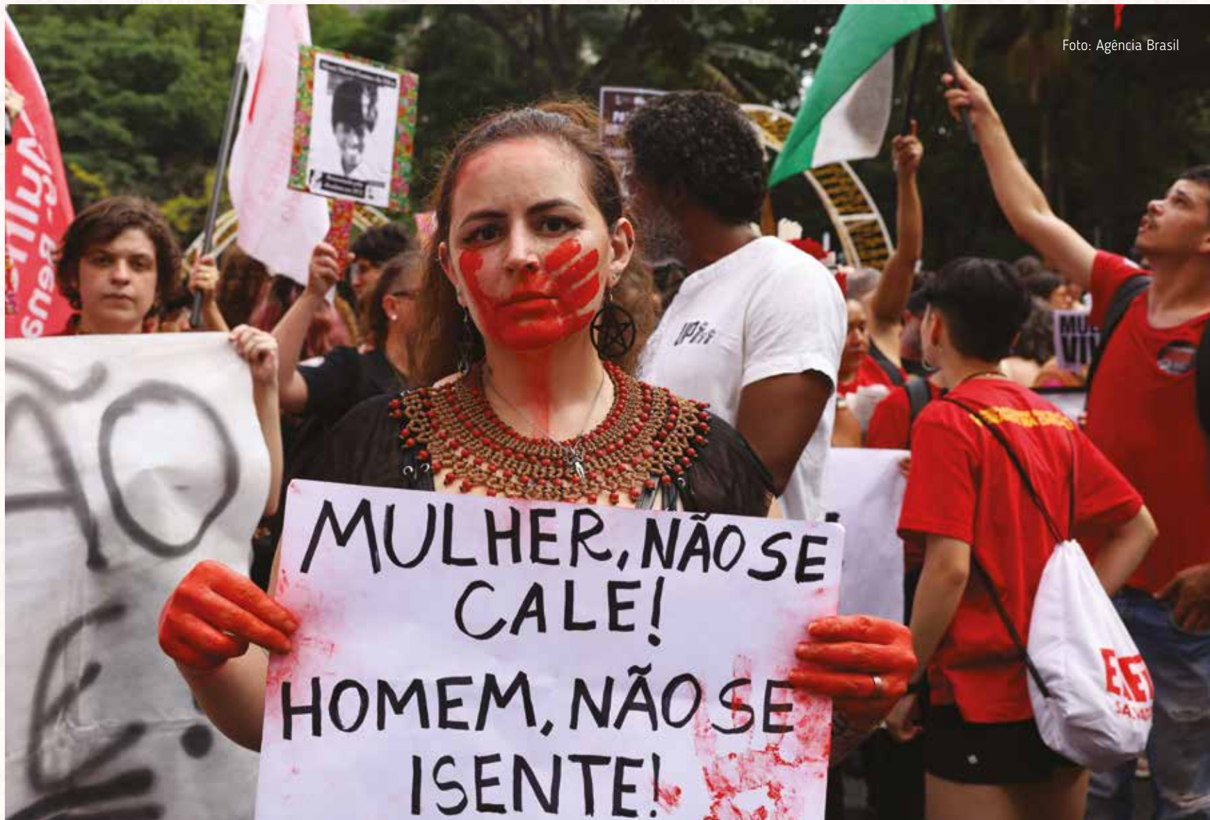
Debate sobre masculinidade é fundamental para avançar.