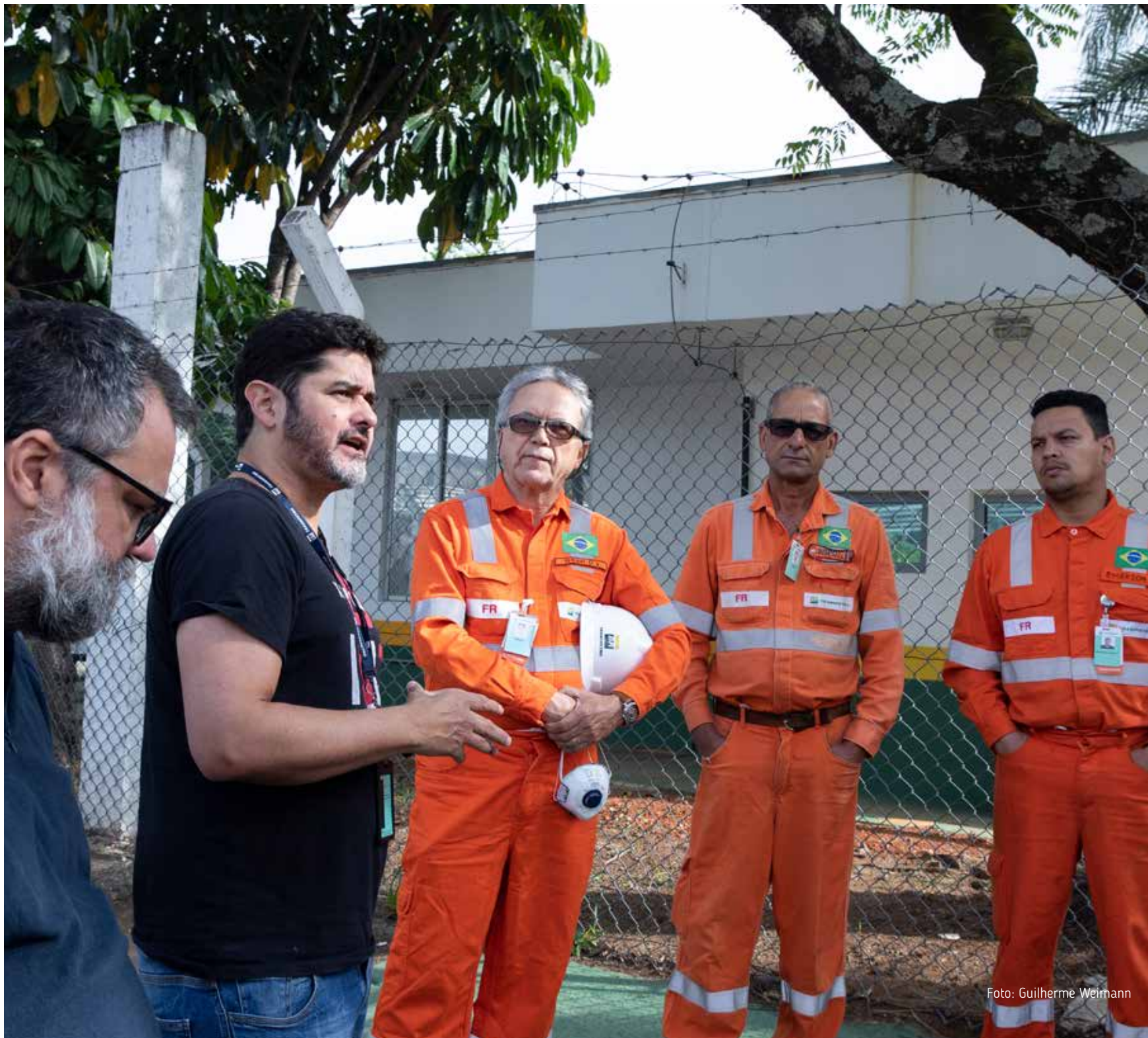
Petroleiros rechaçaram a primeira proposta da PLR apresentada pela Petrobrás