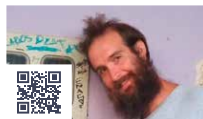
Garantia de não punição

A pressão surtiu efeito, resultando em reunião com as gerências no dia 14.