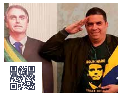
Amigo sem qualificações para o cargo

Imediatamente, o escritório Normando Rodrigues ajuizou ação popular em nome do coordenador da FUP para impedir a nomeação.