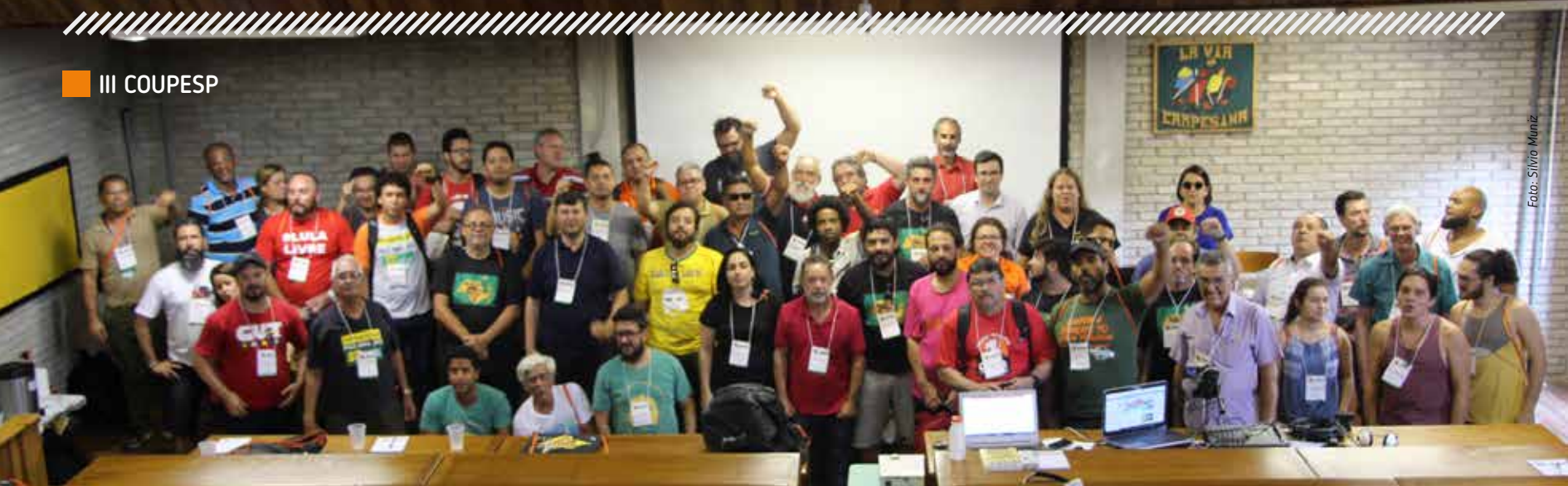
Congresso Unitário: a categoria em defesa dos direitos e da Petrobrás